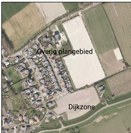
Slingerbos en Molenblok

De koersbepaling is van invloed op de voortgang projecten en daarmee de realisatietermijn voor de woningen. In het geval dat projecten ongewijzigd doorgang kunnen vinden, lijkt start bouw buiten de dijkzones van Slingerbos en Molenblok in 2022-2023 mogelijk. Binnen de dijkzones kan pas gebouwd worden als de dijkversterking is afgerond en de dijk veilig verklaard is. Dit wordt verwacht in de periode 2025-2028.