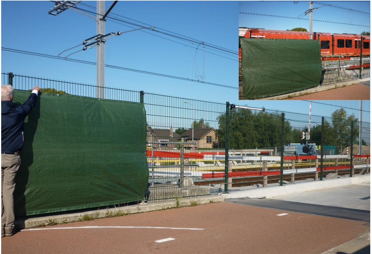
Zo hoog zou de muur door Tricht moeten worden

Aan de westzijde is t.h.v. de Lingedijk een scherm van 1m hoog en 345m lang voorzien. Deze mag ook 0,75m worden en dicht op het spoor staan, bij voorkeur naast het hoofdspoor. Het geluid van de treintjes van de MLL blijft ruimschoots binnen de norm.