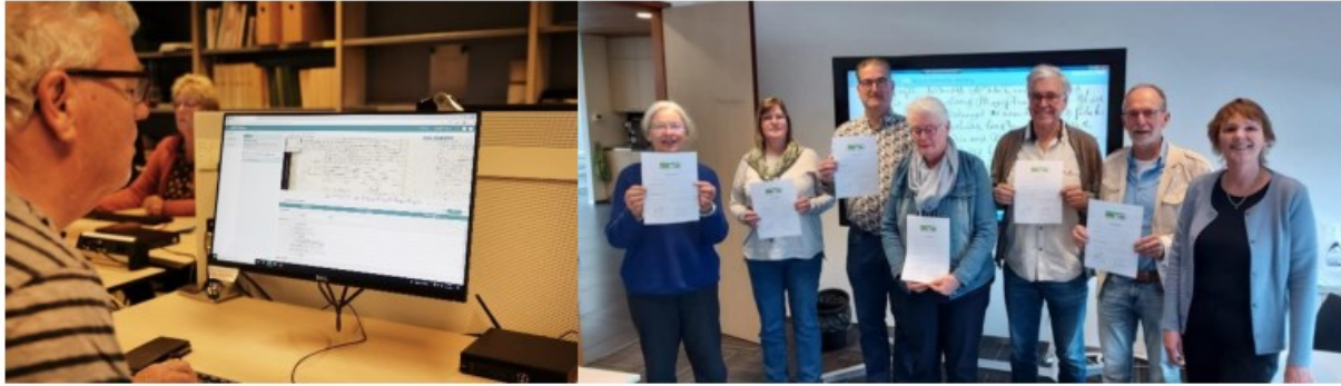
Vrijwilligers aan het werk en Geslaagde cursisten van de cursus oud schrift met rechts collega en docente