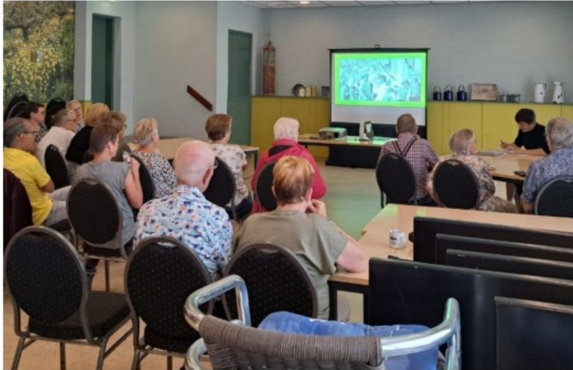
Zomer-tour op 7 verschillende locaties in ons werkgebied.