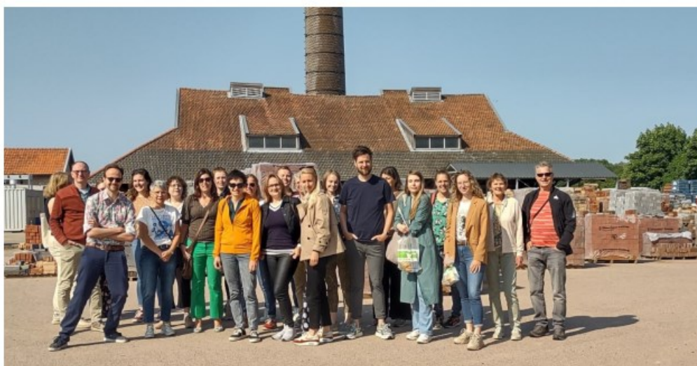
Personeel van het RAR tijdens jaarlijks personeelsuitje, juni 2023