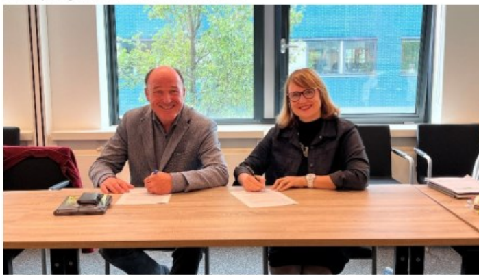
Foto's RAR: Ondertekening van de dienstverlening afspraken rondom e-depot diensten voor BveB