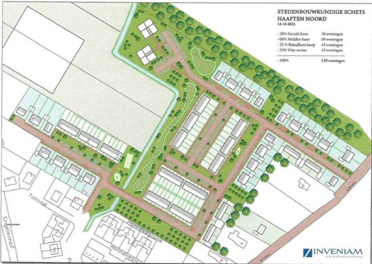
Concept plan Haaften Noord

woningmarktonderzoek heeft West Betuwe een belangrijke overloop functie voor mensen uit de Randstad. De bereikbaarheid van Haaften Noord is richting de A2 zeer goed, zo niet sneller, dan vanuit de Plantage. Een spreiding van woningbouwplannen over verschillende kernen is dan ook logischer. Hierdoor wordt de leefbaarheid en het voorzieningenniveau in dit geval van Haaften vergroot en is er meer draagvlak voor de supermarkt, lokale winkels, sportverenigingen en de MFA Burcht van Haaften. Haaften als (middel)grote kern wordt hierdoor versterkt en is interessant voor zowel de lokale woningbehoefte, als ook bovenregionaal vanuit de Randstad.