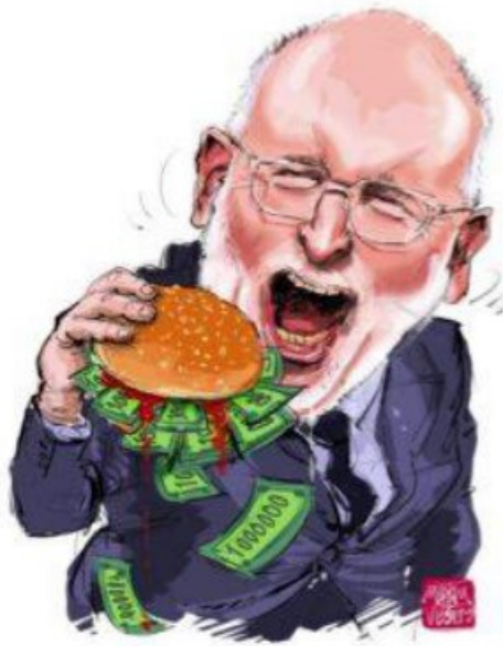
Ik lust de burger rauw!

Mijn punt is en blijft, dat er sprake is van niet werkende corrigerende maatregelen door de Green Deal aanpak met als gevolg een enorme verkwisting van financiën.