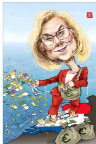
Ze smijt niet met geld, maar ze zaait het!