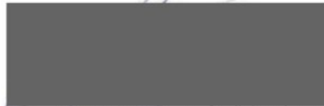
Vicevoorzitter portefeuillehouders- overleg Mobiliteit Regio Rivierenland