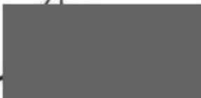
Voorzitter Regio Rivierenland