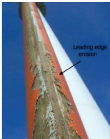
Slijtage van wieken

d. En wat te denken van de grote hoeveelheden kankerverwekkende BISFENOL A en fijnstof afkomstig van slijtage van de kunststof wieken? De erosie veroorzaakt per windturbine 180 kg per jaar aan fijnstof;