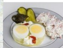
Een hapklaar Russisch ei

Elektriciteit opwekking met windturbines op zee: