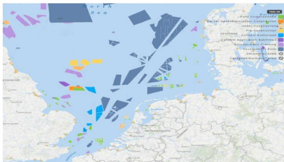
Huidige en toekomstige windparken in Noordzee.

4. Windturbine parken op zee zijn een open deur.