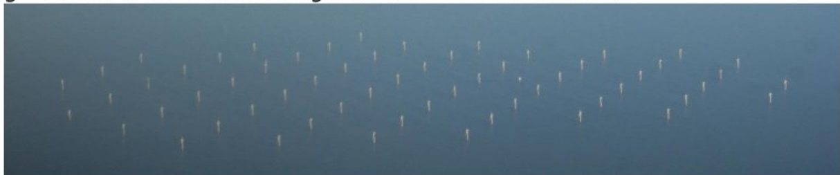
Luchtfoto Prinses Amaliawindpark. 60 windturbines. 120 MW. Oppervlak 14 km 2

Wanneer worden nu de twee kerncentrales geplaatst waar bijna 2 jaar geleden een besluit over is genomen? >Sint Juttemis?