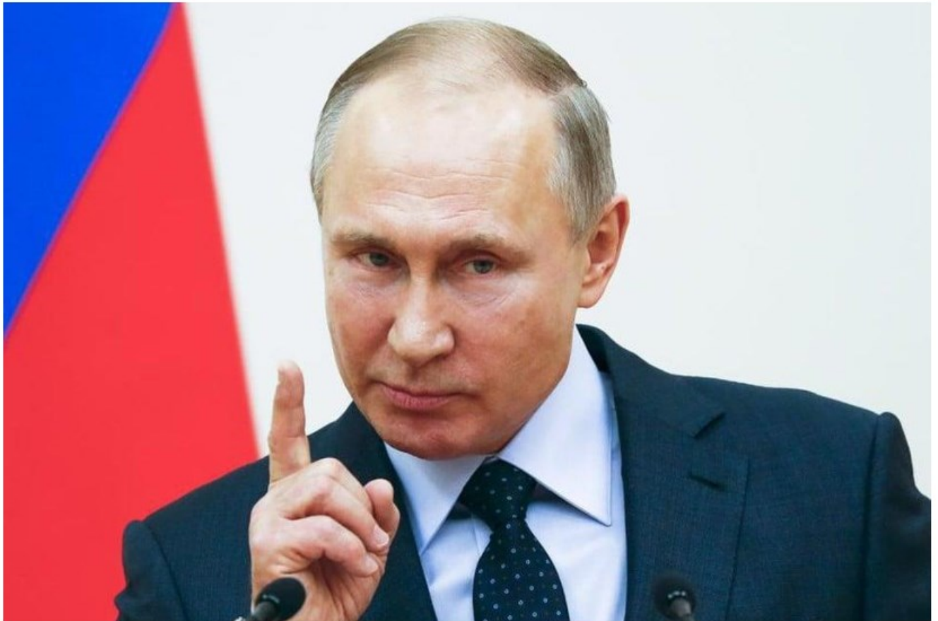
De Russische president Poetin: "wees gewaarschuwd".