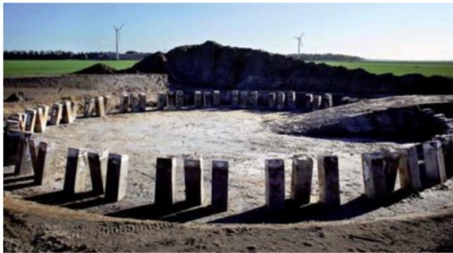
heipalen op land

Er wordt nu een techniek ontwikkeld om de palen draaiend de grond in te krijgen.