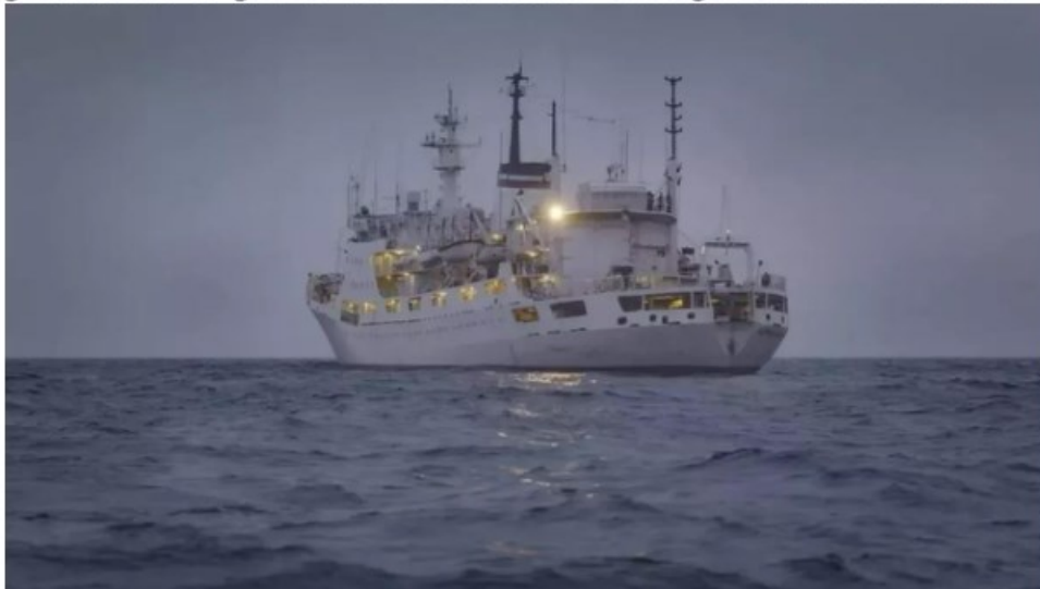
De Admiral Vladimirsky, het Russische onderzoeksschip dat door de journalisten gevolgd werd.

"Rusland is in staat om windmolenparken en communicatiekabels in de Noordzee te saboteren. Dat blijkt uit een onderzoek van verschillende Noord-Europese openbare omroepen. Daarin wordt duidelijk hoe Russische schepen vermomd als vissersboot of onderzoeksschip via onderwatercamera's informatie verzamelen, die Rusland zou kunnen gebruiken in geval van een totale oorlog met het Westen.