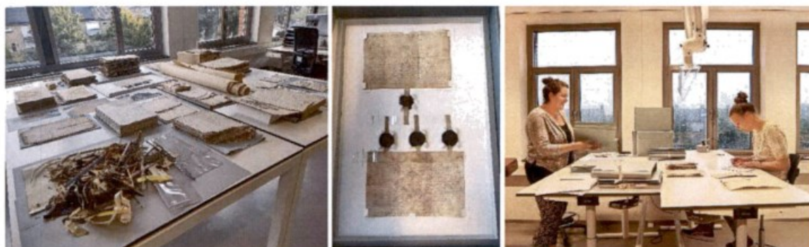
Foto's RAR: vlnr: diverse schades uitgesteld, Charters verpakt en medewerkers behoud en conservering aan het werk

In 2022 is 280 meter archiefmateriaal herverpakt voor duurzame opslag en/of van nieuwe etiketten voorzien. Daarnaast zijn er vele meters herverpakt tijdens (her)inventarisatie. Van 58 meter archief brachten we de materiële staat en de eventuele schade in kaart door het uitvoeren van schade-inventarisaties. Van de archieven met schade werd bijna 47 meter geconserveerd en gerestaureerd: dat zijn circa 2600 inventarisnummers.