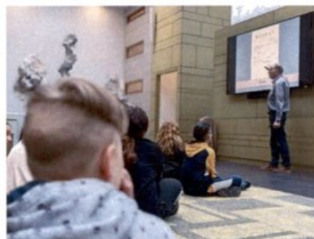
Educatieprogramma over de tweede wereld oorlog en Oral History

De volgende speerpunten en prioriteiten zijn voor het taakgebied dienstverlening in 2022 gerealiseerd: