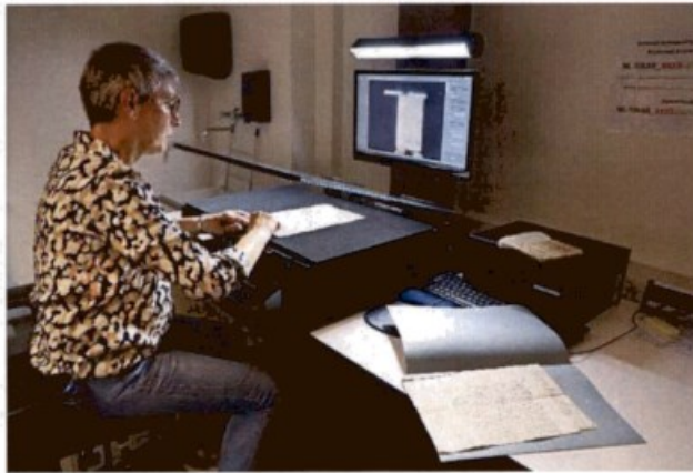
Medewerker RAR aan het digitaliseren voor publieke verzoeken