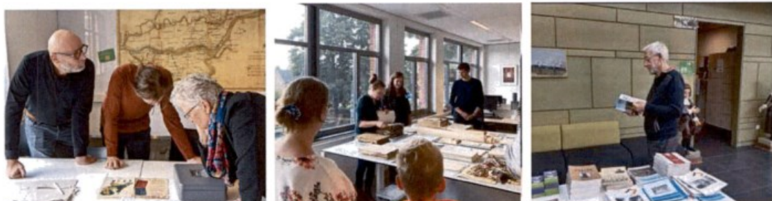
Foto's RAR Open dag vlnr: puzzelen bij de Break-in box, rondleiding langs de het werkveld RAR, boekenverkoop.

De bereikte resultaten in het archiefprogramma zijn binnen de financiële kaders gerealiseerd. De financiële paragrafen laten cijfers en kengetallen zien, waaruit blijkt dat de financiële positie van het Regionaal Archief Rivierenland zich binnen de gestelde kaders en normen begeeft. We realiseren in 2022 een positief resultaat van € 179.617,-. Lagere personeelslasten door meerdere vacatures en lagere lasten van kantoor- en reiskosten als gevolg van het meer structureel, gedeeltelijk thuiswerken hebben hier mee te maken. Toch is een van de belangrijkste oorzaken van dit resultaat de besparing die is gerealiseerd door het uitstellen van de vervanging van onze inventaris (ca € 90.000,- aan lastenvermindering). Dit, in combinatie met de extra inkomsten door onze dienstverlening en toezichtstaken richting GR-en, zorgt voor een positief resultaat.