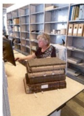
Foto's RAR: Ontsluiting van papieren archieven: kaarten project Tiel en bevolkingsregisters gemeenten