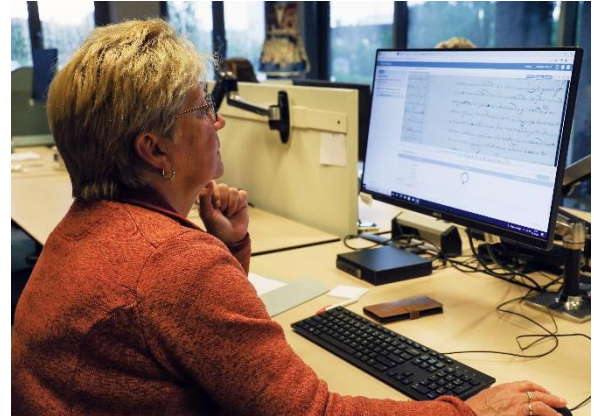
vlnr: Digitalisering van stukken en vrijwilliger aan het werk bij het RAR