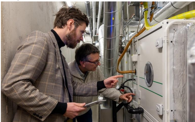
Inspectie bij de installaties van de depots

Regulier en groot onderhoud gebeurt door de VvE op basis van het Meerjarenonderhoudsplan (MJOP) wat gezamenlijk binnen de VvE is opgesteld. Jaarlijks wordt door het RAR een bedrag betaald aan de VvE voor de uitvoering van het MJOP. In het MJOP is rekening gehouden met de bouwkosten index inflatie en heeft een looptijd van 30 jaar. De Meerjarenonderhoudsbegroting (MJOB) wordt 2 jaarlijks geactualiseerd. Hierin worden uiteraard nieuwe technologische ontwikkelingen meegenomen.