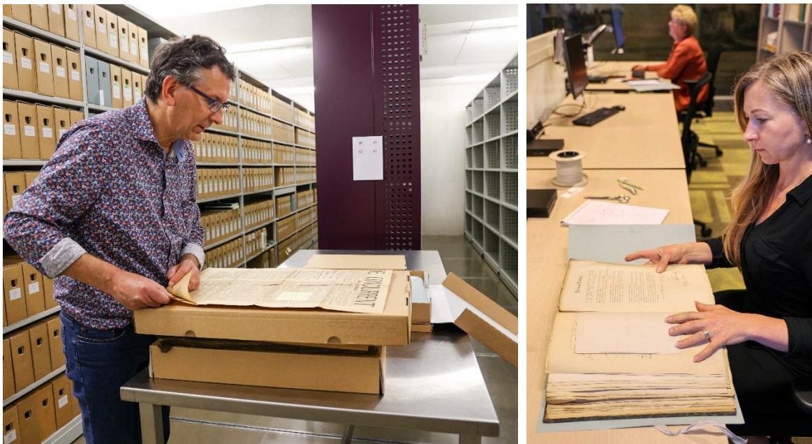
vlnr: de bibliotheek bij het RAR en vrijwilligers aan het werk bij het RAR