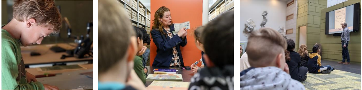
vlnr: Educatieprogramma over de tweede wereld oorlog en Oral History