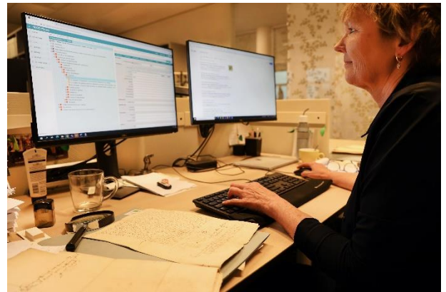
Foto's Jikke Fotografie & Vormgeving vlnr: Conservering- en inventarisatiewerkzaamheden bij het RAR