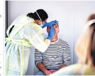
Teststraten in supportershome en bij brandweer