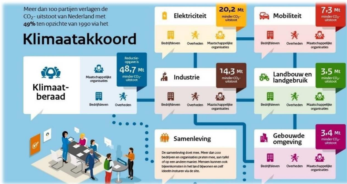
Figuur 1 Klimaatakkoord en klimaattafels

De decentrale overheden hebben vanuit het ontwerp Klimaatakkoord de verantwoordelijkheid om in hun regio energiestrategieën op te stellen. Veel van de afspraken uit het Klimaatakkoord moeten immers in de regio's en gemeenten worden waargemaakt. Dit geldt in het bijzonder voor de ruimtelijke inpassing van locaties van hernieuwbare energie, opslag en de infrastructuur voor warmte en elektriciteit. Dertig energieregio's, waaronder Rivierenland, stellen een RES op waarin zij uitwerken welke bijdrage zij leveren aan de landelijke doelstellingen voor duurzame energie. Deze bijdrage wordt ook wel het RES-bod genoemd. Eerst wordt een concept RES opgesteld, dan volgt nadere uitwerking in een RES 1.0 en vervolgens tweejaarlijks actualisatie in een RES 2.0 etc.