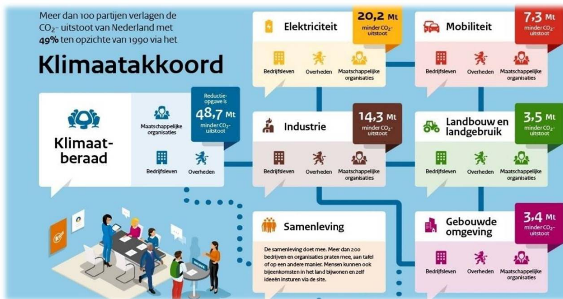
Figuur 1 Klimaatakkoord en klimaattafels