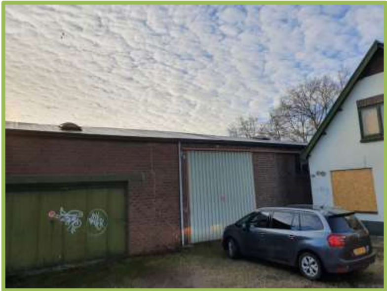
Verharding en loods

Geldermalsen is gesitueerd in de westelijke uithoek van de provincie Gelderland en bevindt zich centraal in het deel van de Betuwe dat de Tielerswaard genoemd wordt. De gehele noordzijde van Geldermalsen grenst aan de rivier de Linge; op de andere oever bevinden zich de kleinere dorpen Tricht en Buurmalsen. In het zuiden grenst Geldermalsen aan het dorp Meteren.