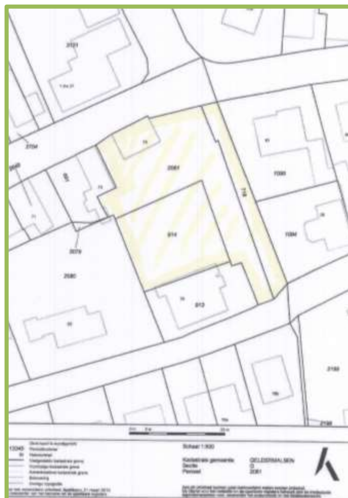
Planlocatie Geldersestraat 75 Geldermalsen

De geplande ontwikkelingen betreffen het perceel aan de Geldersestraat 75 te Geldermalsen. Dit adres is gelegen aan een doorlopende weg richting het Centrum van Geldermalsen. Op het perceel staat een woonhuis en loods in een dusdanige conditie dat deze gesloopt en herontwikkeld zal worden. Het buitenterrein is begroeid met gras, enkele struiken en berk en is deels verhard met tegels en klinkers. De woning en de loods zijn opgetrokken uit enkel steens bakstenen muren en zijn respectievelijk bedekt met pannen en bitumen.