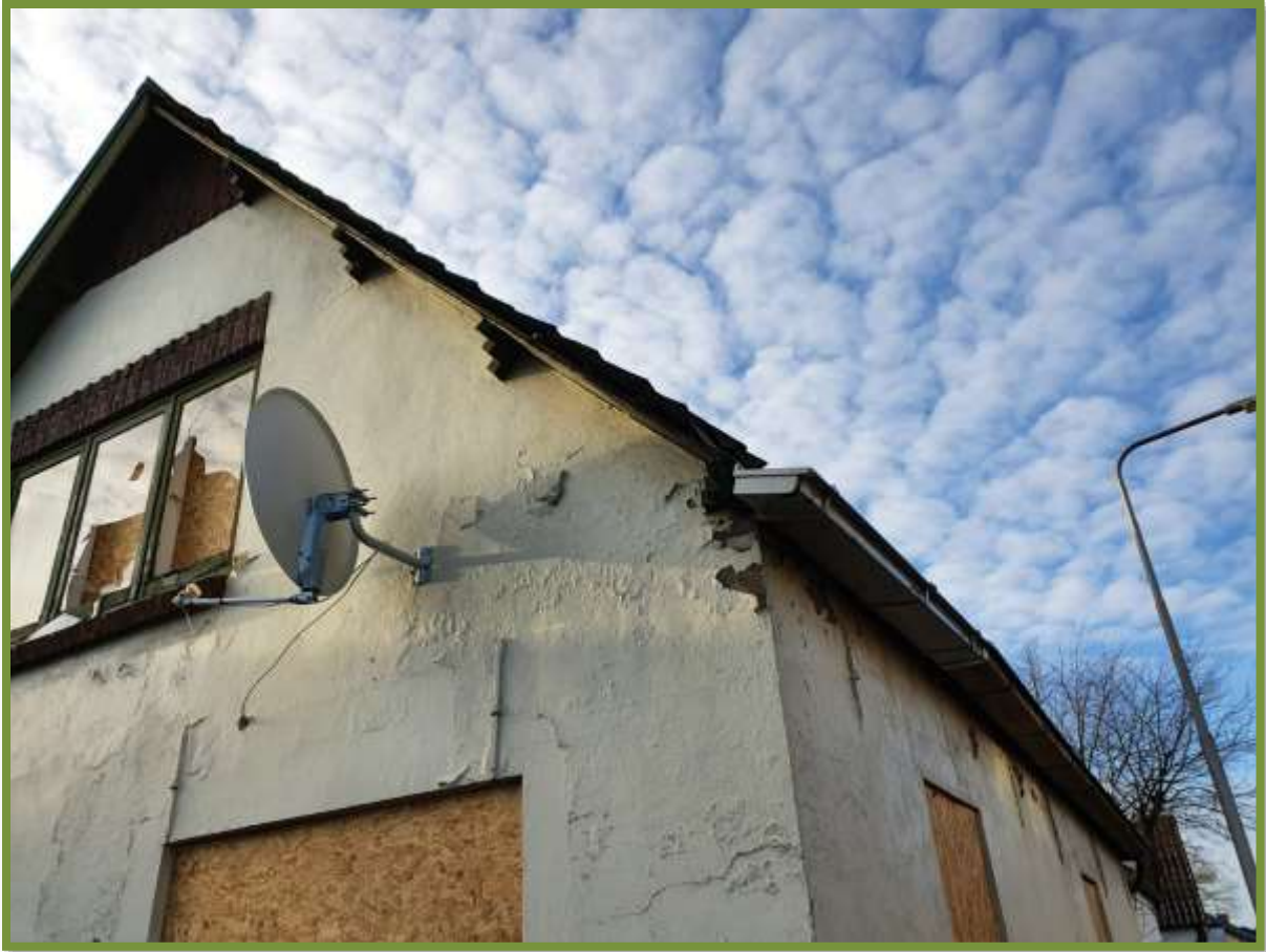
Toegankelijk voor de vleermuis