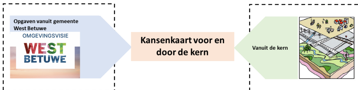
Figuur 3 Inputstromen voor het opstellen van een Kanskaart