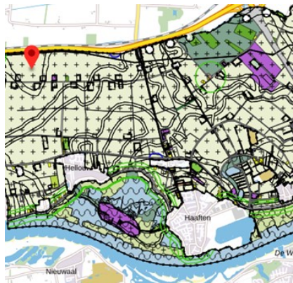
Figuur 2 Bestemmingsplan Buitengebied