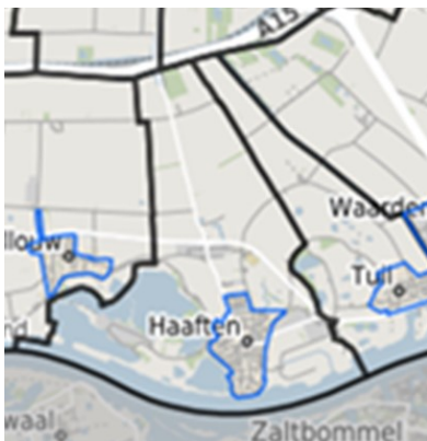
Figuur 1 Woonplaatsgrens en bebouwde kom grens

Het gedeelte van de woonplaats dat niet gelegen is in het Bestemmingsplan Buitengebied (dit is niet hetzelfde als de bebouwde kom). Zie figuur 1 en 2 ter illustratie.