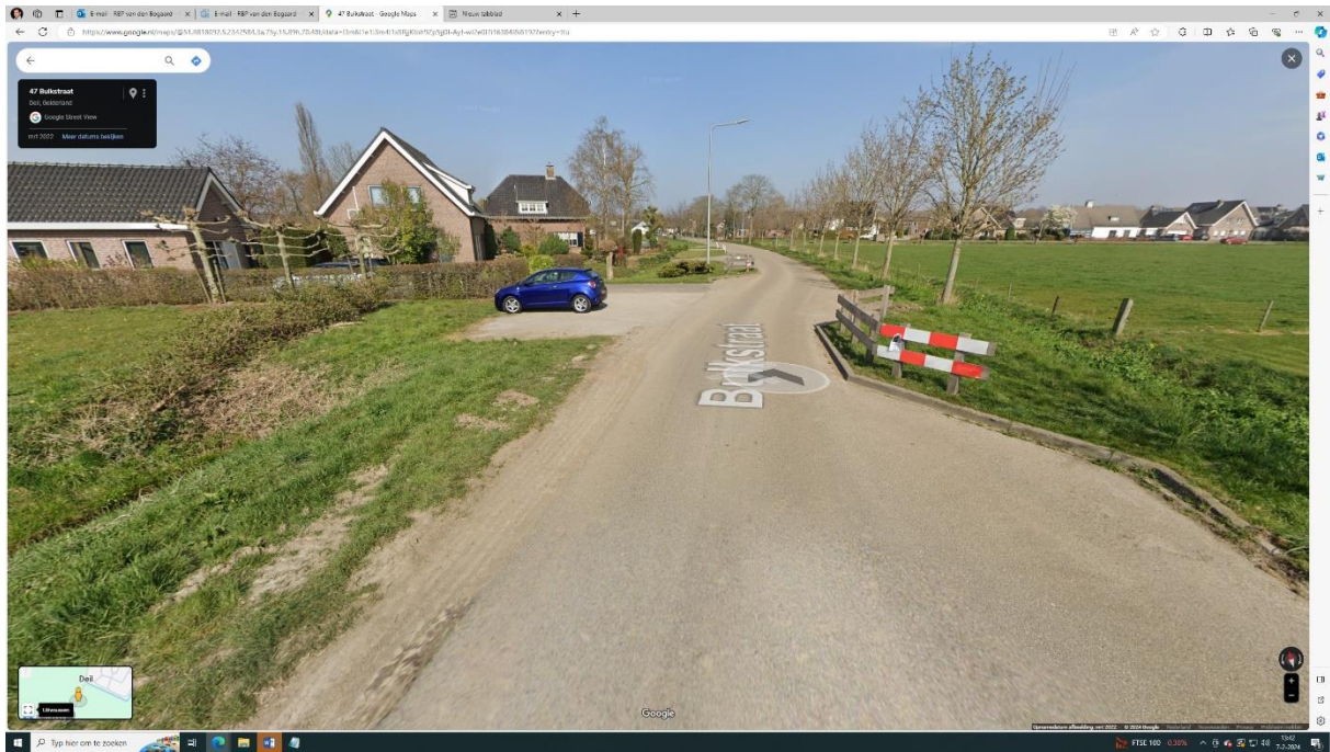
Foto met zicht op de bulkstraat, gesitueerd tussen weilanden en vrijstaande huizen. Verder is er een wegversmalling in beeld zonder afzonderlijke fietspaden die het fietsverkeer van de auto's op de rijbaan kunnen scheiden.