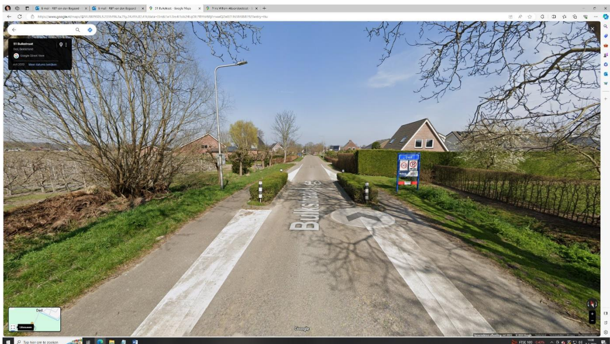
Foto met zicht op de bulkstraat bij een bord waarbij de bebouwde kom wordt verlaten. Ook hier is een wegversmalling zichtbaar, maar dan met twee afzonderlijke fietspaden aan weerszijden van de wegversmalling.