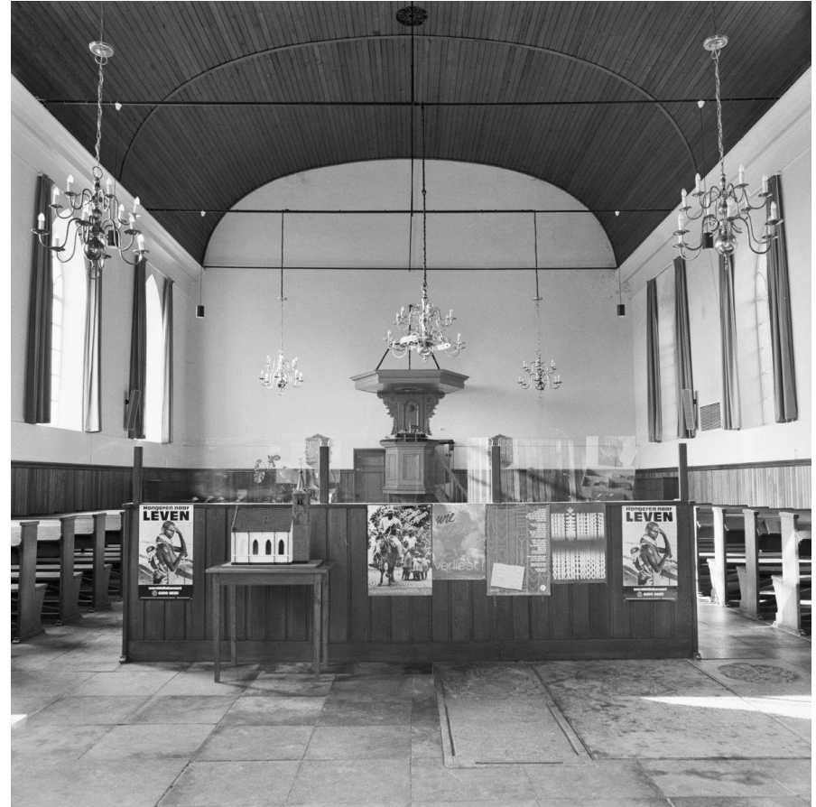
Interieur van de kerk in oostelijke richting, circa 1985 (Archief RCE, nr.1234).